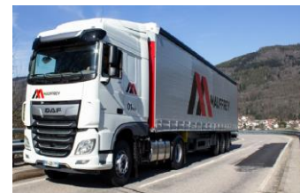
Tautliner et logistique