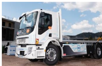
Plateau et convoi exceptionnel